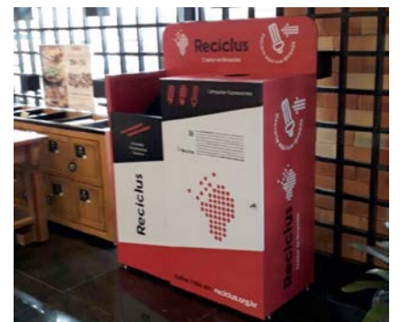
Ponto de coleta em Porto Alegre, que já tem 7 dos 17 pontos previstos em funcionamento