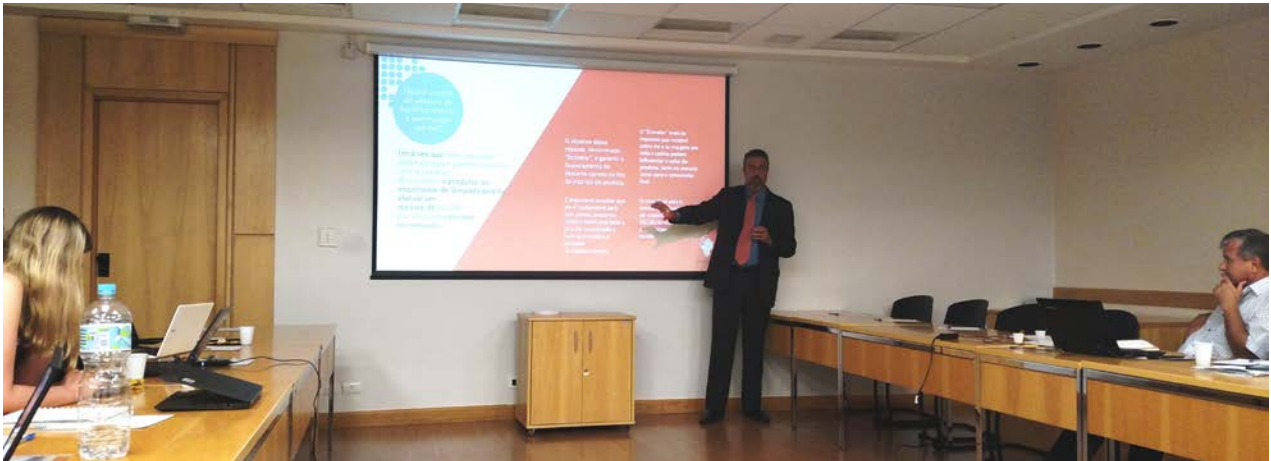
Reciclus foi convidada a participar de reunião da ABIHPEC, onde foram apresentados os desafios e resultados do programa