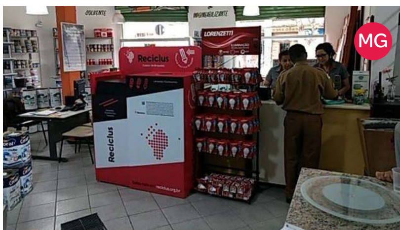
Depósito Rio Verde – Contagem (MG)