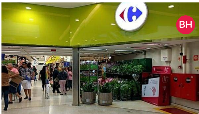
Carrefour BH Shopping – Belo Horizonte (MG)