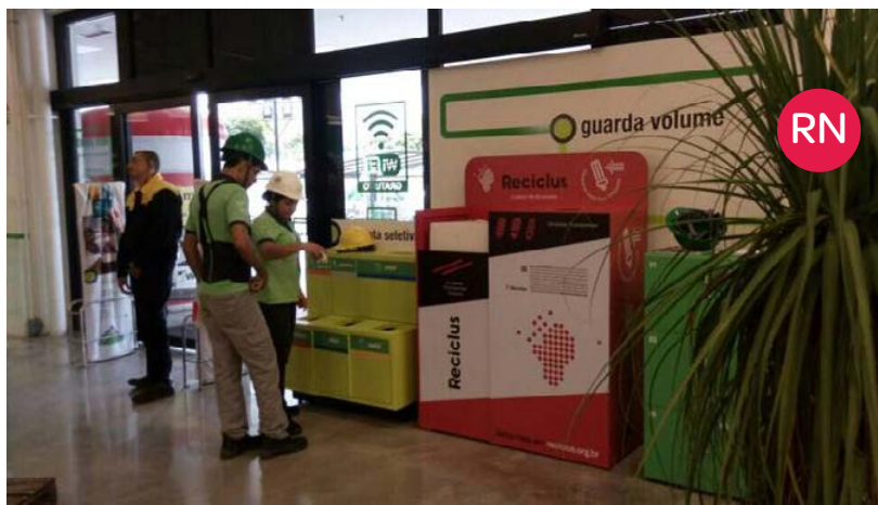
Leroy Merlin – Natal (RN)